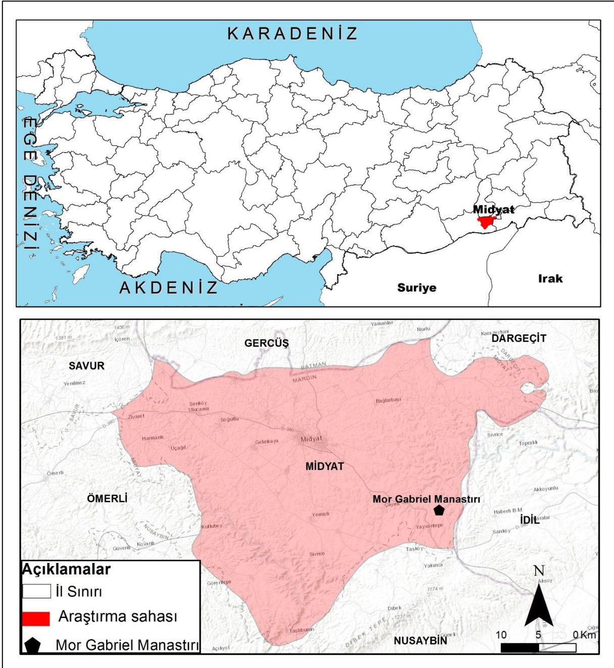
Harita 2: Mor Gabriel Manastırı lokasyon Haritası

Çalışmada izlenen yöntemlerden öncelikli olarak durum tespiti yapılmıştır. Bu amaçla Mor Gabriel Manastırı'nın geçmişten günümüze kadar tarihsel süreci hakkında detaylı literatür taraması yapılmıştır. Bu amaç doğrultusunda Turizm ve Kültür Bakanlığı, Mardin Turizm İl Müdürlüğü, Mardin Valiliği ve Mardin İl Kütüphanesi'nden çeşitli kaynaklar elde edilmiştir. Detaylı literatür taramasının ardından bölgede önde gelen STK'lar, ve Midyat Süryani Kültür Derneği ve yerel halk ile manastır ile ilgili bilgiler toplanmıştır. Çalışmanın sonraki aşamasında manastırın ileri gelenlerinden gerekli izinler alındıktan sonra sahada anket çalışmasına başlanmıştır. Önceden hazırlanan anket formu manastırı ziyaret eden turistlere uygulanmıştır. Bu çerçevede toplam 100 kişiye anket uygulanmıştır. Uygulanan anket çalışması üç aşamada ele alınmıştır. Birinci aşamada manastır gelen turistlerin demografik ve sosyal yapıyı belirlemek, ikinci aşama bu yapıya yaş, eğitim, öğrenim durumu gibi değişkenler ile çapraz analizler yapmak amaçlanmıştır. Anket uygulamasının üçüncü aşamasında ise manastırı ziyaret eden turistlerin yerel kültürel turizm ilişkileri belirlenmeye çalışılmıştır.