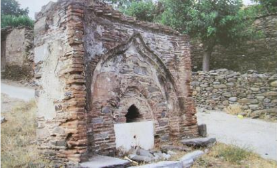
Resim 17. Bıçakçızade Çeşmesi Kaynak: Ünal, 2001

Derviş Ağa Camii'nin karşısında Koca Çeşme adı ile de anılan bu çeşme Bıçakçı es-Seyid Hacı Ali Ağa tarafından 19.yy.'da yılında yaptırıldığı bilinmektedir (Ünal, 2001) ve günümüzde önemli bir turistik çekiciliği olan tarihi değer olarak varlığını devam ettirmektedir.