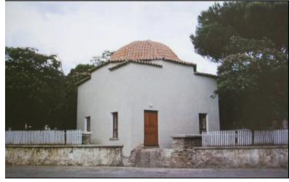
Resim 19. Kütüphane

Derviş Ağa Camii'nin karşısında Koca Çeşme adı ile de anılan bu çeşme Bıçakçı es-Seyid Hacı Ali Ağa tarafından 19.yy.'da yılında yaptırıldığı bilinmektedir (Ünal, 2001) ve günümüzde önemli bir turistik çekiciliği olan tarihi değer olarak varlığını devam ettirmektedir.