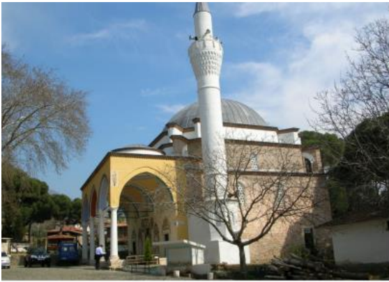
Resim 10. Derviş Ağa Camii (Çarşı Camii)

Önemli bir tarihi yapı bu camii inşa kitabesi bulunmamakla birlikte 1782 tarihli vakfiyesi vardır. Yaptıran Yaptıranı Karazade Mustafa Efendidir. Turistik çekicilik açısından önemli bir tarihi yapı olan camii büyük ölçüde özgünlüğünü korumuş ve bölgedeki diğer camilere göre ikinci planda kalmıştır (Önkal,1993).