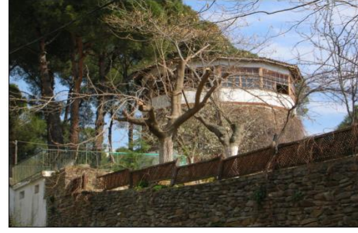
Resim 6. Pankuduz Kulesi

Sultan Şah Türbesi'nin en önemli mimari özelliği moloz taştan yapılmış ve altıgen üzerinde kiremit kaplı bir kubbe ile örtülü olmasıdır. Bu somut kültürel yapının kitabesinde Hanzade Hatun'a ait türbenin 1310 yılının yılında inşa edildiği bilinmektedir. Sultan Şah türbesi Aydınoğulları Beyliği'nin kurucusu olan Fatih Mehmet Bey'in kız kardeşi Hanzade Hatun'a ait bölgenin tarihsel kimliğini oluşturan önemli turistik çekicilik yapılarıdır (Ünal ve Yücel, 2018).