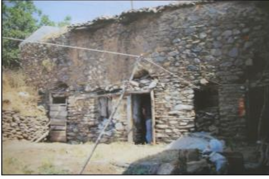
Resim 13. Kale Medresesi Kaynak: Demiralp, 2001

Günümüzde harap vaziyette ve turistik çekiciliği açısından değerinin yok olmaya yüz tutmuş bu tarihi yapının 16. ya da 17. yy. 'da inşa edildiği bilinmektedir. Var olan kısmı ile Birgi'nin kuzeyinde İmam Birgivi Caddesi üzerinde yer almaktadır.