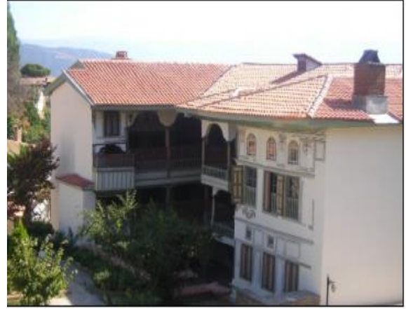
Resim 3. Çakırağa Konağı.

1312'de Aydınolu Mehmet Bey tarafından inşa edilen cami (Tuncer ve Gülhan, 2018) geleneksel ahşap ve çini süslemelerin en iyi örneklerini içermektedir Birgi Ulu Camii'nin mihrabı ve minberi, zamanlarının en iyi korunmuş örneklerinden biridir. Günümüzde bölge halkı tarafından kullanılan bu tarihi yapı çeşitli restorasyon çalışmalarından geçmiştir. Aydınolularının ilk camisi özelliğini taşıyan yapı, medrese ve türbesiyle bir külliye düzeni olarak inşa edilmiş ve ayrıca caminin güneydoğusundaki bulunana hamamda bu külliyenin bir parçası olarak önemli bir mimari yapı olarak karşımıza çıkmaktadır (Ercoşkun ve Uygur, 2018).