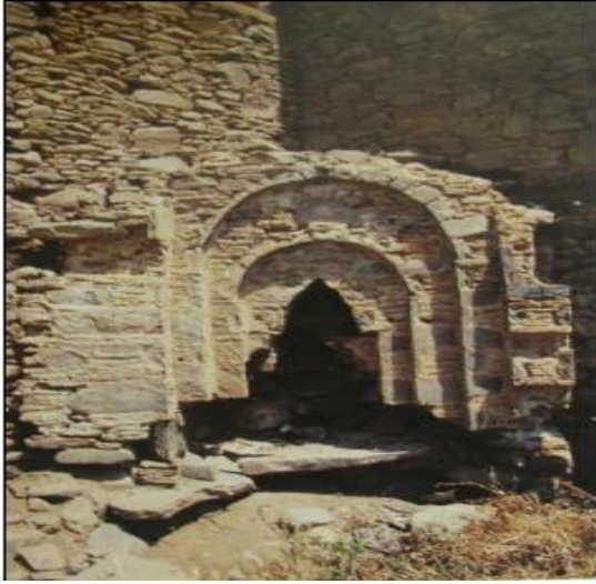
Resim 18. Beyler Çeşmesi

Birgi tarihi yerleşim yerinin çarşısında yer alan bu tarihi yapı, yakın zamanda onarılmış bu onarım sırasında kubbe de alaturka kiremitle kaplandığında günümüzde turisti çekiciliği açısından önem arz etmektedir. Bu tarihi değer inşaa kitabesi bulunmamaktadır ancak ilgili kaynaklarda yapının 17.yy'ın yüzyılın ikinci yarısından sonra yapıldığı bilinmektedir (Kuyulu, 2001).