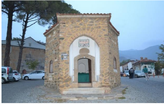
Resim 5. Sultan Şah Türbesi

Tarihin izlerinin görüldüğü bu yerleşim yerinde geleneksel Osmanlı mimarisini yansıtan tarihi evlere rastlamak mümkündür. Geçmişten günümüze birden fazla medeniyete ev sahipliği yapmış çok katmanlı kültürel mirası ile Birgi, sahip olduğu sokakları ve mimarı dokusunun korunması sürdürülebilmesi açısından bölgenin tarihsel kimliği için önemlidir. Saçan vd. (2019)'ne göre Birgi'nin yerel karakterinin ve tarihi çevresini çağdaş kullanım koşullarına uyumu ile somut kültürel mirasın sürdürülebilirliği açısından tarihi alanların özgünlüğünü koruyabilen nadir çok kültürlü yerleşim alanlarından biridir.