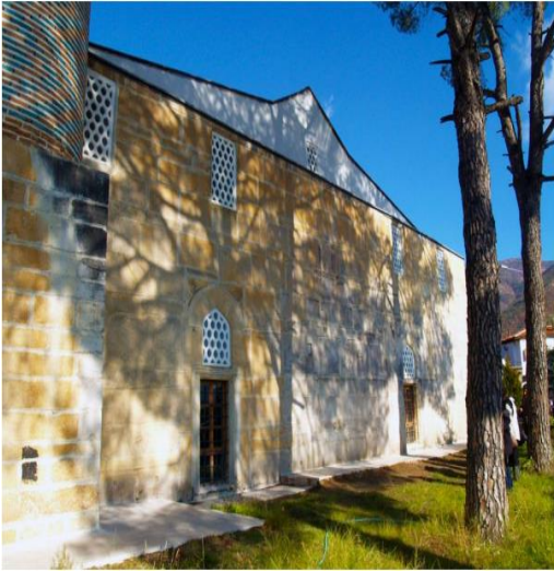
Resim 2. Birgi Ulu Camii

Tuncer ve Gülhan (2016)'nın yaptığı tespitlere göre, tarihi Birgi evleri ve tarihi sokak dokusu bölgenin geleneksel simgesini oluşturmaktadır. Ayrıca Birgi'de geleneksel mimari dokuyu en iyi yansıtan iki mimari somut kültürel değeri Ulu Camii ile Çakırağa Konağıdır.