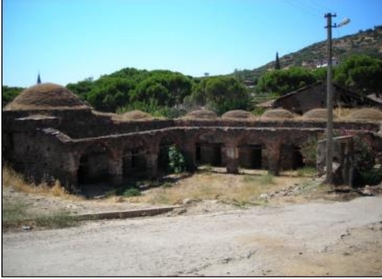
Resim 14. Derviş Ağa Darulhadisi (Çukur Medresesi)

Günümüzde harap vaziyette ve turistik çekiciliği açısından değerinin yok olmaya yüz tutmuş bu tarihi yapının 16. ya da 17. yy. 'da inşa edildiği bilinmektedir. Var olan kısmı ile Birgi'nin kuzeyinde İmam Birgivi Caddesi üzerinde yer almaktadır.