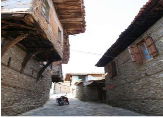
Resim 4. Birgi Dar Sokakları

Tarihin izlerinin görüldüğü bu yerleşim yerinde geleneksel Osmanlı mimarisini yansıtan tarihi evlere rastlamak mümkündür. Geçmişten günümüze birden fazla medeniyete ev sahipliği yapmış çok katmanlı kültürel mirası ile Birgi, sahip olduğu sokakları ve mimarı dokusunun korunması sürdürülebilmesi açısından bölgenin tarihsel kimliği için önemlidir. Saçan vd. (2019)'ne göre Birgi'nin yerel karakterinin ve tarihi çevresini çağdaş kullanım koşullarına uyumu ile somut kültürel mirasın sürdürülebilirliği açısından tarihi alanların özgünlüğünü koruyabilen nadir çok kültürlü yerleşim alanlarından biridir.