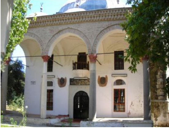
Resim 9. Karaoğlu Camii

Günümüzde kullanılmayan bu tarihi yapı Sasalı Mahallesi ile kent merkezi arasında bulunmaktadır. Yapılış tarihi ile ilgili bir kitabe bulunmamakla birlikte 15. yy 'da inşa edildiği mimari özelliklerine göre değerlendirilmektedir (Ünal, 2001).