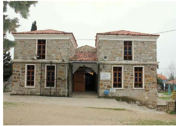
Resim 12. İmam Birgivi Medresesi

Güdük Minare Mescidi 1969 yılına kadar sağlam iken zaman içinde oluşan bakımsızlık nedeniyle günümüzde caminin bir kısmı tamamen yok olmuş bir kısımda harap ve bakımsız bir vaziyettedir. Bu tarihi yapının inşa tarihini veren bir kitabesi bulunmamakla birlikte 14. Yy da inşa edildiği bilinmektedir (İlter, 1969). Kurt Gazi Mahallesi'nde, yapının adını verdiği sokakta (Güdük Minare Sokak) bulunmaktadır.