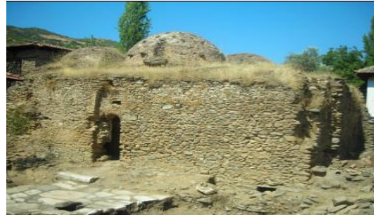
Resim 7. Şeyh Muhittin Hamamı

Ne zaman inşa edildiği tam olarak bilinmemekle birlikte 1998 yılında turizm amaçlı restore edilen yapı Derviş Ağa Camii'nin güneydoğusunda yer almaktadır. Günümüzde turistik çekiciliği olarak kullanılan bu tarihi yapı). Restorasyon sonucunda orijinal özelliklerinin çoğunu kaybetmiştir (Dural, 2004).