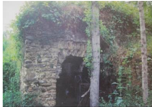
Resim 8. Sasalı Hamamı

Sade bir kuruluşa sahip olan hamam Derviş Ağa Hamamı olarak isimlendirilmeye o tarihte yapıldığı dair bir kitabe bulunmamaktadır. Ancak, Hamamın mimari özellikleri ve tarihi veriler 15.yy yüzyıla yapıldığını göstermektedir. Ayrıca 1994 yılında İzmir Arkeoloji Müzesi'nce denetimi yapılan hamam günümüzde kullanılmamaktadır (Çakmak, 2001).