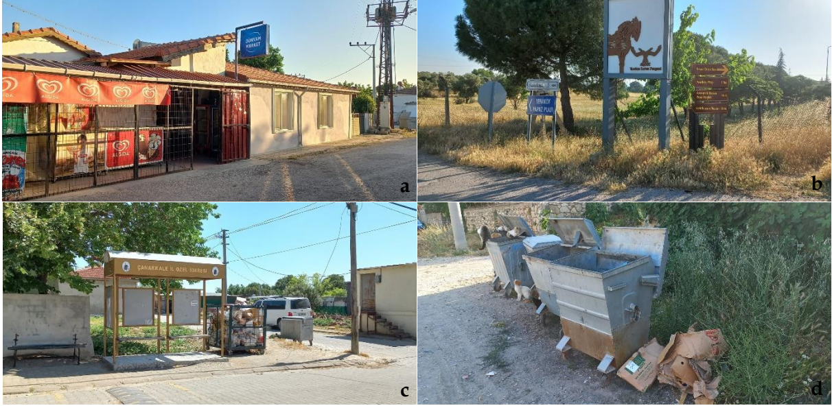
Şekil 16. Sokak mobilyaları [a: Halileli, b: Kalafat, c: Kumkale, d: Yeniköy] (Orijinal, 2022).