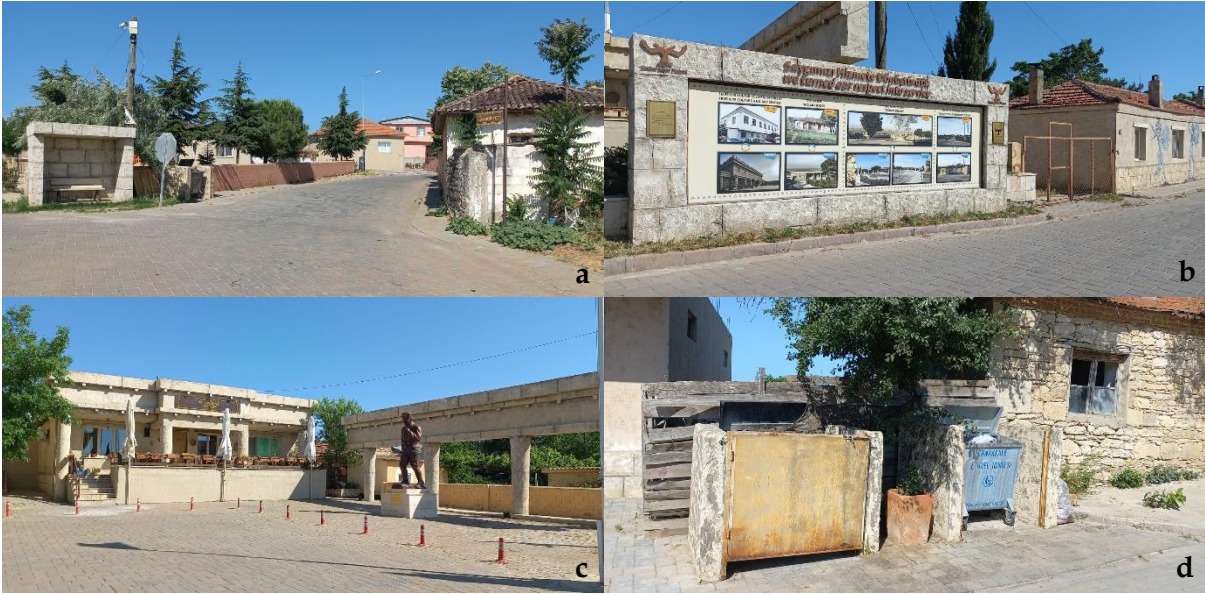
Şekil 15. Tevfikiye Köyü'nde sokak mobilyalarından [a: durak, b: tanıtım tabelası, c: baba, d: çöp konteyneri] örnekler (Orijinal, 2022).

Tevfikiye Köyü'nde; duraklar ile yönlendirme, işaret ve tanıtım tabelaları, köye kazandırılan arkeo-köy kimliği bağlamında yenilenmiştir (Şekil 15a-b). Ancak Çıplak Köyü'nde olduğu gibi klasik çöp konteynerleri ile farklı malzeme, renk ve boyutlarda olan, bazıları yıpranmış yönlendirme, işaret ve tanıtım tabelaları da görülmektedir. Ayrıca köyde dikkati çeken bir diğer detay da kırsal kimliğe uygun olmayan kırmızı plastik babalardır. Tüm bunların yanı sıra köyün mevcut kırsal kimliğine çok da uygun olmayan ve yıpranmış durumda renkli ahşap bank ve çöp kutuları da bulunmaktadır (Şekil 15c-d). Köy meydanında eski ve bakımsız durumda olan bir adet çeşme mevcuttur.