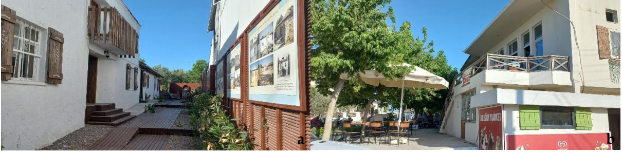
Şekil 11. Çıplak Köyü [a: yerel tarih evi, b: kahvehane] (Orijinal, 2022).

mevcuttur fakat taşınmalı eğitim nedeniyle kullanılmamaktadır. Yine her iki köyde, önemli bir ortak kullanım mekânı olarak düğün salonu da bulunmamaktadır. Tüm bunların yanı sıra Çıplak Köyü'nde berber, kurs merkezi ve yerel tarih evi (Şekil 11a) bulunmaktadır. Ayrıca Çıplak Köyü'nde bir adet kahvehane (Şekil 11b), Halileli Köyü'nde ise üç adet kahvehane ve çay evi (Şekil 12a) mevcuttur (Polat ve Yeleş, 2018: 109).