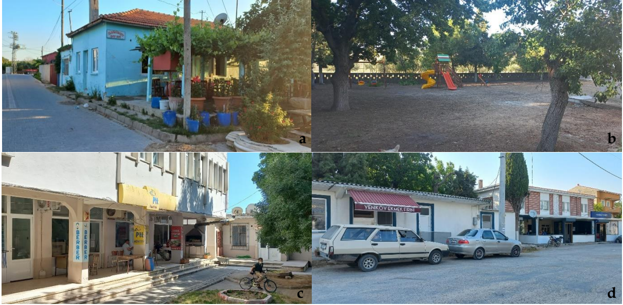
Şekil 12. Ortak mekân kullanımları [a: Halileli, b: Kalafat, c: Kumkale, d: Yeniköy] (Orijinal, 2022).