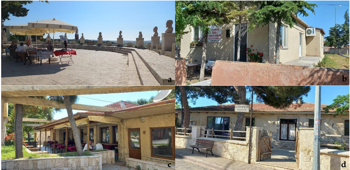
Şekil 13. Tefikiye Köyü'nde yer alan ortak mekân kullanımları [a: Troya Meydanı, b: sağlık kabini, c: kahvehane, d: pansiyon] (Orijinal, 2022).

Sokak Mobilyaları (yönlendirme, işaret ve tanıtım tabelaları, duraklar, çöp kutuları, aydınlatma elemanları, çeşme vb.): Çıplak ve Tefikiye köylerinde; söz konusu köylerin temaları kapsamında yapılan, mekâna özgü düzenlemeler ve yenileme çalışmaları mevcuttur.