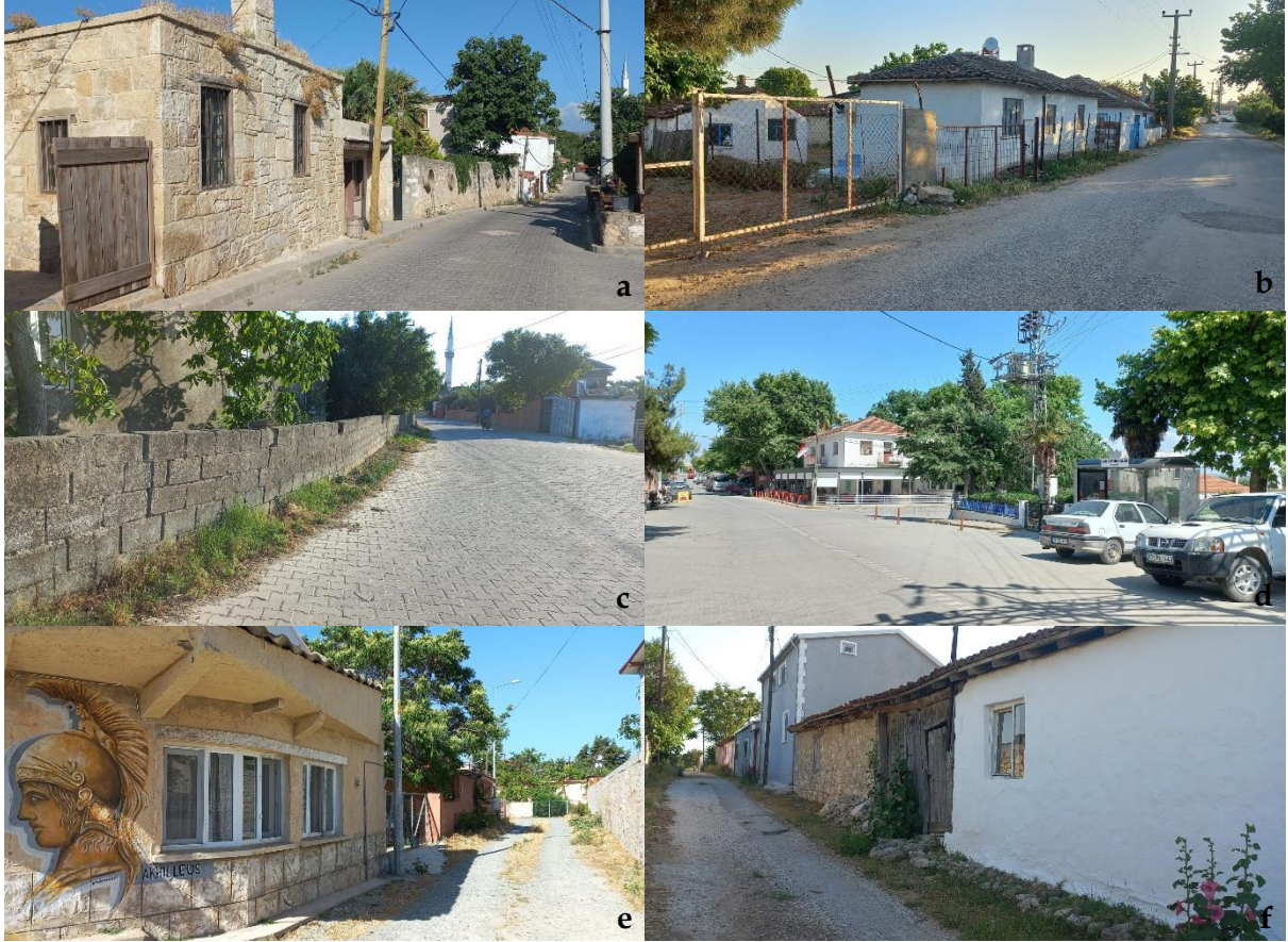
Şekil 7. Yollar [a: Çıplak, b: Halileli, c: Kalafat, d: Kumkale, e: Tefikiye, f: Yeniköy] (Orijinal, 2022).

Yollar: Köylere ulaşımı sağlayan yollar asfalt malzemeden yapılmış olmakla birlikte yol yenileme çalışmaları kapsamında köylerin tümünde; çoğunlukla kırsal yerleşimlere uygun olmayan ve niteliksiz bir kaplama elemanı olan kilit parke taş kullanıldığı görülmektedir. Tüm köyler içerisinde yer yer bozuk toprak ve bozuk asfalt yollar ile birlikte sokak dokularında birbirinden farklı malzeme geçişleri de mevcuttur.