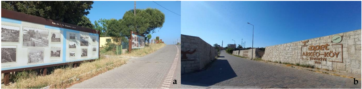
Şekil 4. Köy girişleri ve köylerdeki yapı duvar süslemeleri [a: Çıplak, b: Tefikiye] (Orijinal, 2022).

Köy Girişi: Tefikiye ve Çıplak köyü girişlerinde; OPET tarafından gerçekleştirilen 'arkeo-köy' ve 'etno-köy' temalı iyileştirme projeleri kapsamında köylerin girişini daha belirgin ve kimlikli hale getiren çeşitli düzenlemeler mevcuttur (Şekil 4a-b). İki köyde de; evlerin duvar, kapı ve pencere gibi yapısal elemanlarına sözü edilen temalara uygun desen ve süslemeler uygulanarak, kimliklendirme çalışmaları yapılmıştır (Şekil 5a-b).