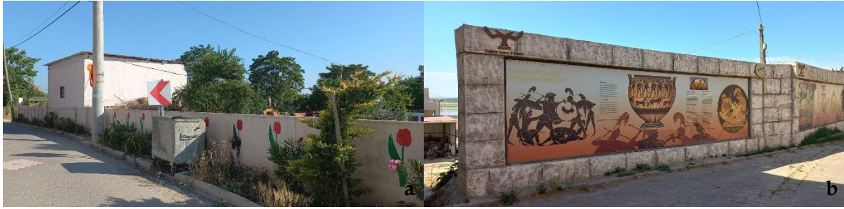
Şekil 9. Köylerin temasına uygun olarak düzenlenen sınırlayıcı öğeler [a: Çıplak, b: Tevfikiye] (Orijinal, 2022).

Ortak Mekân Kullanımları: Tüm köylerde okul binası mevcuttur ancak atıl durumdadır. Kumkale dışındaki tüm köylerin ilk ve orta eğitimi taşınabilir sistem ile Kumkale Köyü'nde yapılmaktadır (Şekil 10).