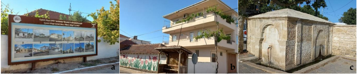
Şekil 14. Çıplak Köyü'nde sokak mobilyalarından [a: tanıtım tabelası, b: durak, c: tarihi çeşme] örnekler (Orijinal, 2022).

Tevfikiye Köyü'nde; duraklar ile yönlendirme, işaret ve tanıtım tabelaları, köye kazandırılan arkeo-köy kimliği bağlamında yenilenmiştir (Şekil 15a-b). Ancak Çıplak Köyü'nde olduğu gibi klasik çöp konteynerleri ile farklı malzeme, renk ve boyutlarda olan, bazıları yıpranmış yönlendirme, işaret ve tanıtım tabelaları da görülmektedir. Ayrıca köyde dikkati çeken bir diğer detay da kırsal kimliğe uygun olmayan kırmızı plastik babalardır. Tüm bunların yanı sıra köyün mevcut kırsal kimliğine çok da uygun olmayan ve yıpranmış durumda renkli ahşap bank ve çöp kutuları da bulunmaktadır (Şekil 15c-d). Köy meydanında eski ve bakımsız durumda olan bir adet çeşme mevcuttur.