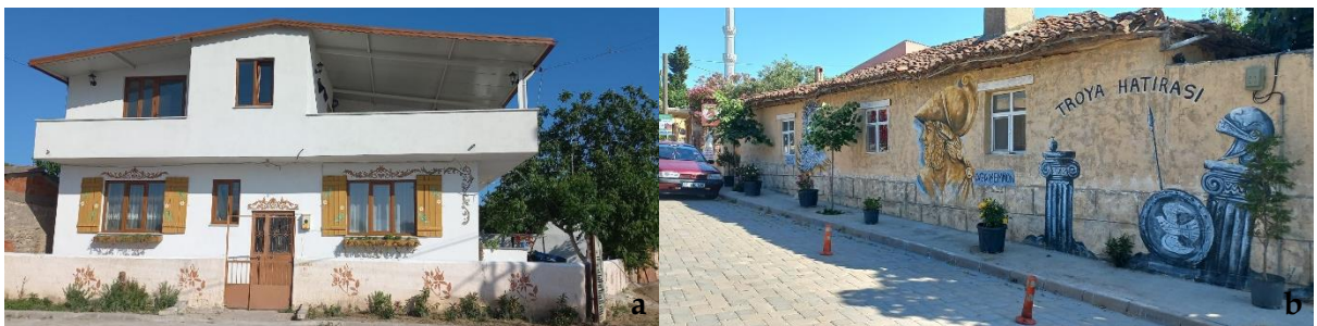
Şekil 5. Köylerdeki yapı-duvar süslemeleri [a: Çıplak, b: Tefikiye] (Orijinal, 2022).