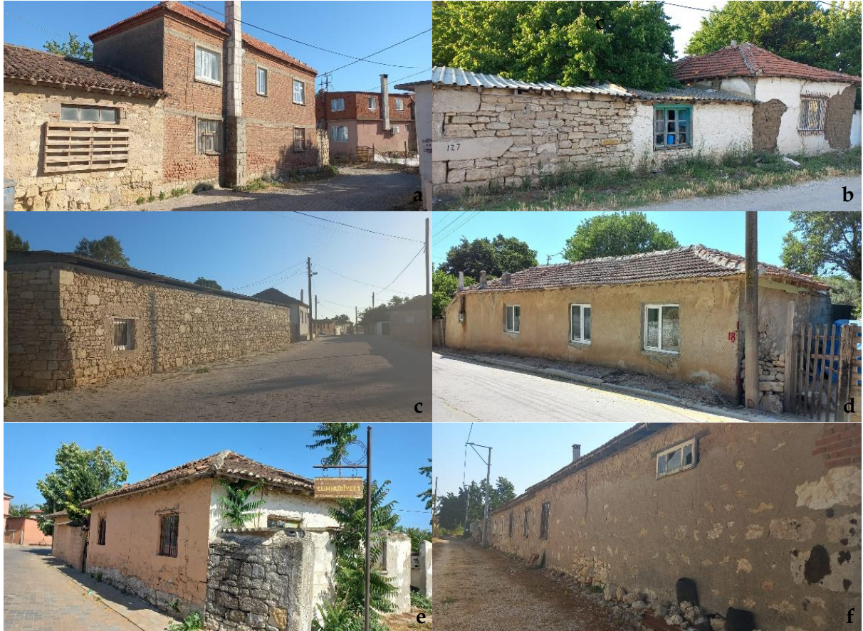
Şekil 17. Yapı türleri, malzeme ve cephe özellikleri [a: Çıplak, b: Halileli, c: Kalafat, d: Kumkale, e: Tevfikiye, f: Yeniköy] (Orijinal, 2022).

Yapı Türleri, Malzeme ve Cephe Özellikleri: Tüm köylerde, Polat (2018a-2018b) ile Polat ve Yeleş (2018)'in belirttiği gibi; taş, kerpiç, ahşap, tuğla, kiremit ve beton köyde kullanılan başlıca yapı malzemeleridir.