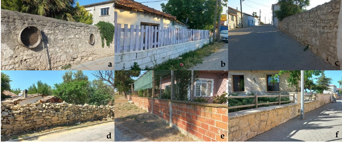
Şekil 8. Sınırlayıcı öğeler [a: Çıplak, b: Halileli, c: Kalafat, d: Kumkale, e: Tevfikiye, f: Yeniköy] (Orijinal, 2022).

Sınırlayıcı Öğeler: Tüm köylerde birbirinden farklı sınırlayıcı elemanlar olmakla birlikte çoğunlukla yığma taş, betonarme, tuğla, ahşap çit ve tel örgü çitten yapılmış oldukları görülmektedir (Şekil 8a-b-c-d-e-f). Sınırlayıcı elemanlar çok çeşitli malzemeden yapılmıştır ancak kullanılan malzeme bağlamında çoğunlukla kırsal kimliğe uygun değildir. Bunun yanı sıra Çıplak ve Tevfikiye köylerinde, köylerin yenilenen kimliğine ve belirlenen temalarına uygun olarak düzenlenen sınırlayıcı elemanlar da mevcuttur (Şekil 9a-b).