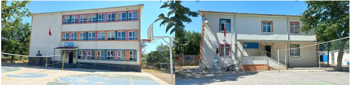
Şekil 10. Kumkale Köyü ilk ve orta dereceli okul yapıları (Orijinal, 2022).

Ortak Mekân Kullanımları: Tüm köylerde okul binası mevcuttur ancak atıl durumdadır. Kumkale dışındaki tüm köylerin ilk ve orta eğitimi taşınabilir sistem ile Kumkale Köyü'nde yapılmaktadır (Şekil 10).