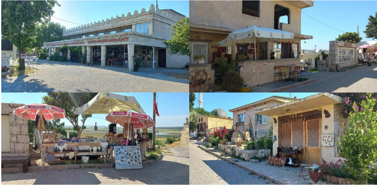
Şekil 3. Tefikiye Köyü yeme-içme mekânları ve hediyelik eşya satış yerleri (Orijinal, 2022).

Sosyo-Kültürel Yapı: Tefikiye ve Halileli Köyü'nün tarihine bakıldığında yerleşikler (manavlar), Yörükler, Türkmenler ve muhacirler (göçmenler) gibi farklı kültürlerin yaşadığı ifade edilmektedir. Bunun yanı sıra Halileli Köyü, Rum-Türk kültürünün yoğun olduğu bir köydür. Beş farklı kültürün bir arada yaşama biçimini ve yaşanan süreci göstermesi açısından, Halileli Köyü önemli bir kırsal yerleşim alanıdır. Kalafat Köyü ve Yeniköy, Bulgar göçmenlerinin kurmuş olduğu köyler olarak bilinmektedir (Polat, 2018a; Polat, 2018b; Polat ve Yeleş, 2018). Adını köyde bulunan Çıplak Dede Türbesi'nden alan Çıplak Köyü ile Kumkale Köyü ise tarihi Osmanlı Dönemi'ne kadar uzanan eski birer Osmanlı köyüdür.