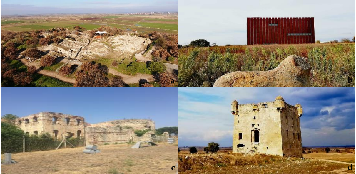
Şekil 18. Tarihi ve arkeolojik yapılar [a: Troya Ören Yeri (Troya Kültür Rotası, 2018d), b: Troya Müzesi (Orijinal, 2022), c: Kumkale Kalesi (Sarıdikmen, 2019), d: Cezayirli Hasan Paşa Köşkü (Orijinal, 2022)].

Tarihi-Arkeolojik Yapılar, Sivil Mimarlık Örnekleri ve Anıt Eserler: TTMP'nin en önemli arkeolojik değeri olan Troya Ören Yeri, arkeolojik özellikleri ile ön plana çıkan Tevfikiye Köyü sınırları içerisinde (Şekil 18a). Alanda yapılan kazı çalışmalarında çıkan arkeolojik buluntuların sergilendiği ve uluslararası ölçekte bir değere sahip Troya Müzesi de (Şekil 18b), yine Tevfikiye Köyü sınırları içerisinde yer almaktadır. Bunun yanı sıra eski bir Osmanlı Köyü olan Çıplak Köyü'nde, Osmanlı Dönemi'ne ait tescil ve restore edilmeyi bekleyen mezar taşları ile tarihi bir çeşme bulunmaktadır.