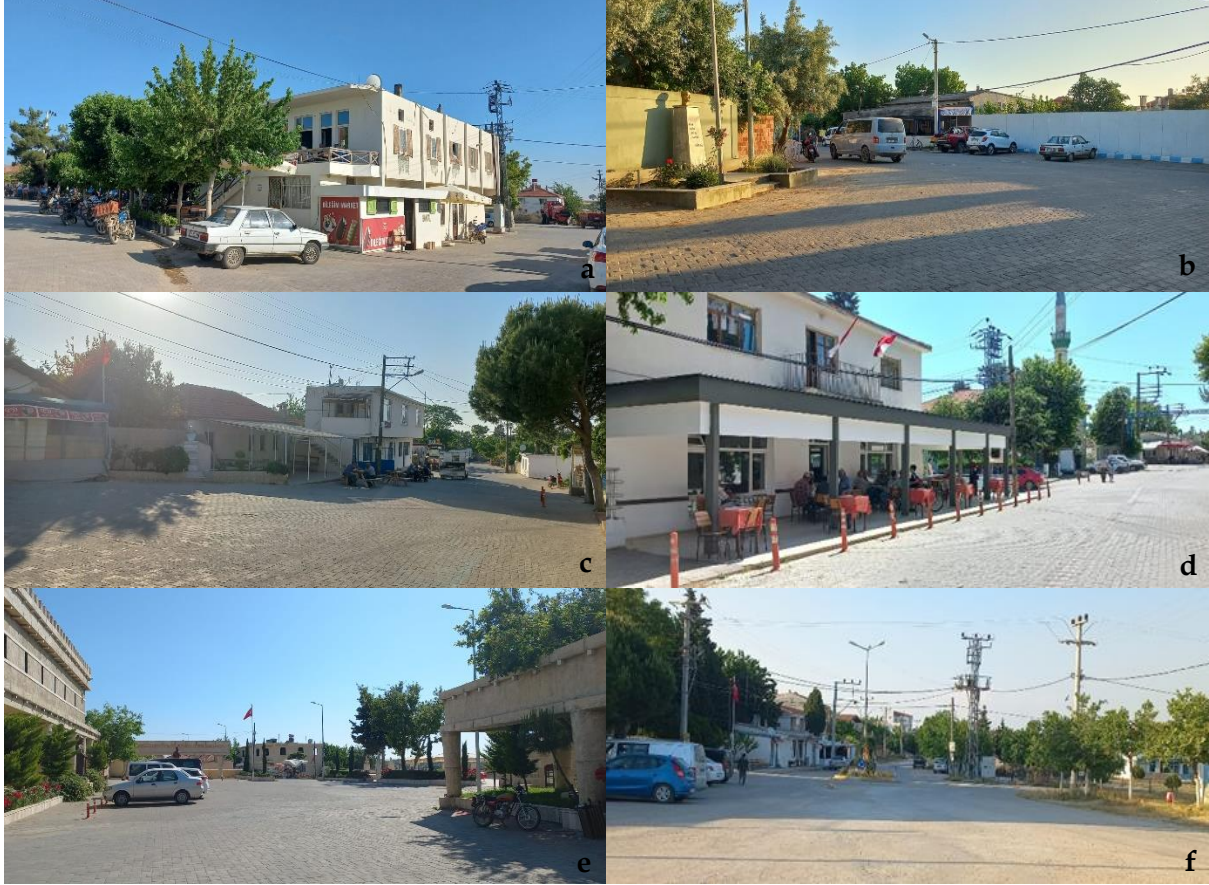
Şekil 6. Köy meydanları [a: Çıplak, b: Halileli, c: Kalafat, d: Kumkale, e: Tefikiye, f: Yeniköy] (Orijinal, 2022).

Köy Meydanı: Çıplak Köyü'nde; köy kahvesi, cami, muhtarlık, kurs merkezi vb. kullanımların yer aldığı bir meydan bulunmaktadır. Bunun yanı sıra bazen köy meydanına, köylülerin ürünlerini satabileceği ürün stantları da yerleştirilmektedir (Şekil 6a).