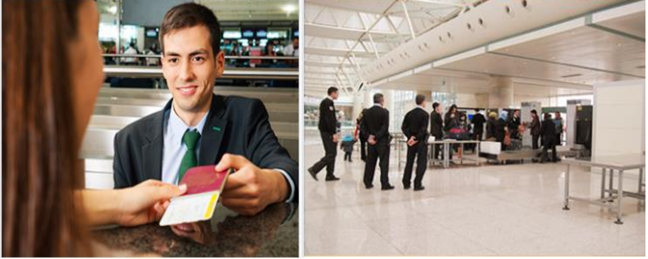
Resim 1 ve Resim 2. Havalimanında Görevliler ve Yolcuları Konu Edinen Fotoğraflar

Ticari Faaliyetler kısmı Havayolları, Kargo, Reklam, TAV Hakkında ve Emniyet Yönetim Sistemi kategorilerinden oluşmaktadır fakat bu kısım çalışmaya dahil edilmemiştir.