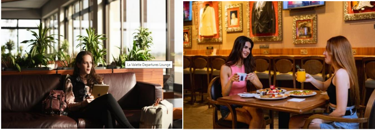
Resim 3 ve Resim 4. Havalimanında Yolculuk Öncesi Yolcuları Konu Edinen Fotoğraflar

Ziyaretçi kısmının Geliş-Gidiş kısmında 1 fotoğraf yer almaktadır. Fotoğrafta bagaj alım kısmından yeni çıkan bir yolcunun annesi olduğu tahmin edilen bir kadınla sarılması yer almaktadır. Fotoğraf sıcak tonların yer aldığı bir fotoğraftır.