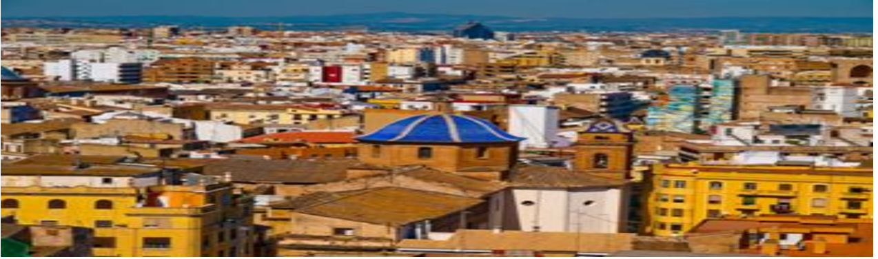
Resim 7. Havalimanının Bulunduğu Şehri Yansıtan, Mimari Zıtlıkları Gösteren Fotoğraf

Web sitesi anasayfa “Havayolları” kısmında herhangi bir görsele yer verilmemiş olup havalimanına sefer düzenleyen havayolu işletmeleri ve logoları yer almaktadır.