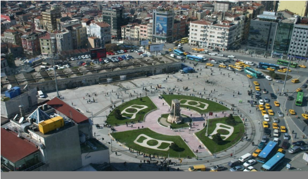
Foto 11. Taksim Meydanı'nın havadan görünüşü

İstanbul'un Beyoğlu ilçesinde yer alan Taksim Meydanı, kentnin en ünlü noktalarından biri niteliğindedir. Çevresinde yer alan yiyecek-içecek işletmeleri, mağazalar, konaklama işletmeleri, eğlence ve kültür yerleriyle, İstanbul'un en büyük turistik çekim merkezinden biridir. Cumhuriyet Döneminde bir meydan haline gelmiş olan Taksim Meydanı, pek çok siyasi ve toplumsal olaya da ev sahipliği yapmıştır ("Taksim Meydanı", 2020). Meydan sınırları içinde İstiklal Caddesi ve Tarihi Çiçek Pasajı gibi önemli kültürel ve turistik çekim alanları bulunmaktadır.