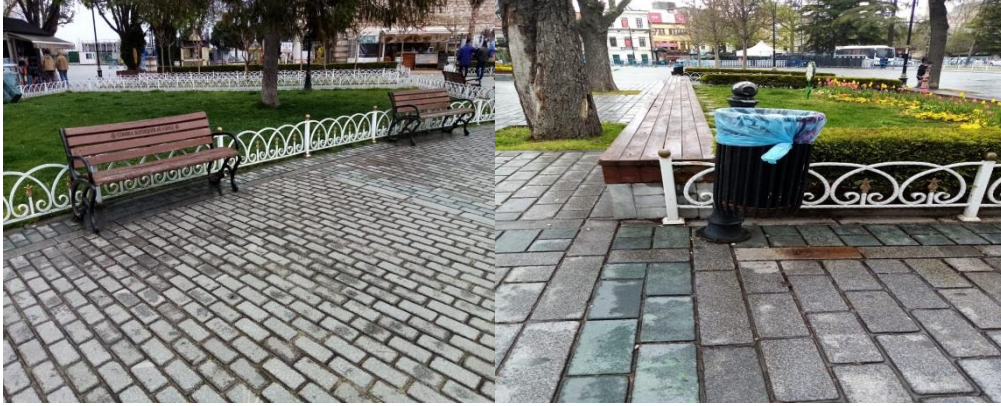
Foto 3. Oturma alanları

çıkabilmeleri için uygun genişliktedir. Görme engelli bireylerinin de bastonu rahat kullanabileceği zemin yapısına sahiptir. Meydana kuzey kısmından giriş sağlayan alanda merdiven yanında yer alan rampa aynı şekilde tekerlekli sandalye girişine uygun ve görme engellilerin rahat kullanabileceği zemin kabartmasına sahiptir.