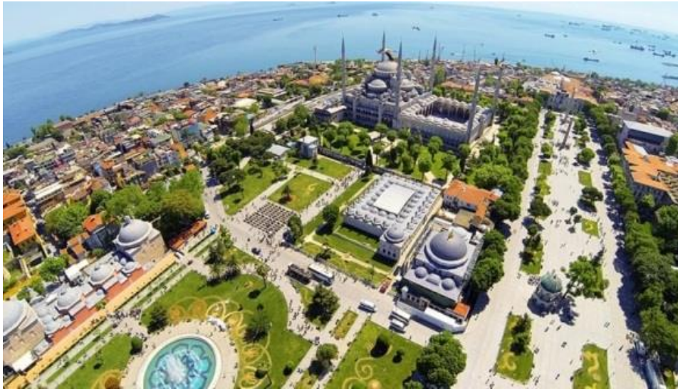
Foto 1. Sultanahmet meydanının havadan görünümü