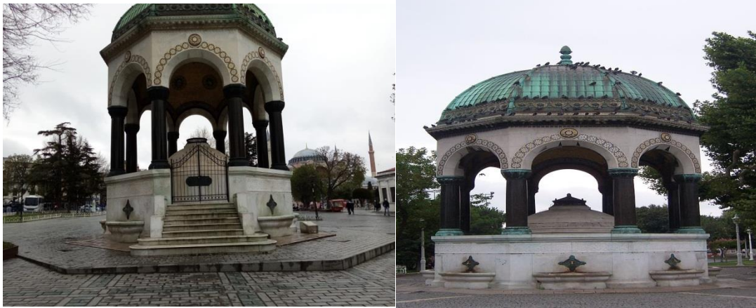
Foto 4. Tarihi alman çeşmesi

Meydan da yer alan oturma alanları “Yaklaşım ve Kullanım İçin Boyut ve Alan” kapsamında değerlendirilmiştir. Bu kapsamda ilgili alanların yanında tekerlekli sandalye kullanıcıları için uygun alan bırakıldığı görülmüş, görme engellileri yönlendirmeye dönük zemin kabartmalarının mevcut olduğu görülmüştür. 50 cm olan çöp kovaları tasarımı tüm kullanıcılar için uygun nitelikte olup damgalanma ya da etiketlenme hissi uyandırmayacak niteliktedir.