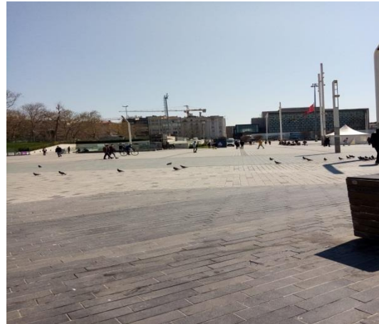
Foto 13. Taksim Meydanı oturma ve dinlenme alanlarına ilişkin görseller

Taksim Meydanı, dinlenebilme kolaylığı açısından iyi planlanmış bir meydan hüviyetinde gözükmese de, ilgili alanda aydınlatmaların oturma alanlarına çok yakın olması, 'Hatalara Tolerans' tasarımı prensibi doğrultusunda risk taşımaktadır. Bu nedenle evrensel tasarım modeli ilkelerine uygun bir nitelik taşımamaktadır.