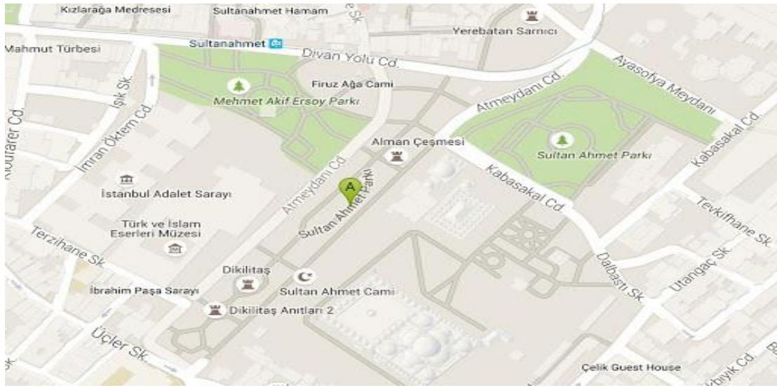
Şekil 1. Sultanahmet Meydanı Krokisi

Dikilitaş: Theodosius Dikilitaşı İstanbul'daki eski Hipodrom'da bulunan en önemli anıtlardan biridir. Dikilitaş, heykel tabanıyla bugün 24,77 metre yüksekliğindedir, ancak tarihi kayıtlar orijinal yapının belirgin şekilde daha yüksek olduğunu göstermektedir. Ayrıca, kayıtlar bazı parçaların nakliye nedeniyle Mısır'da geride kaldığını göstermektedir. Dikilitaş, özellikle depremler olmak üzere birçok doğal yıkıcı olaya maruz kalmıştır (Polat ve Saygılı, 2020: 170).