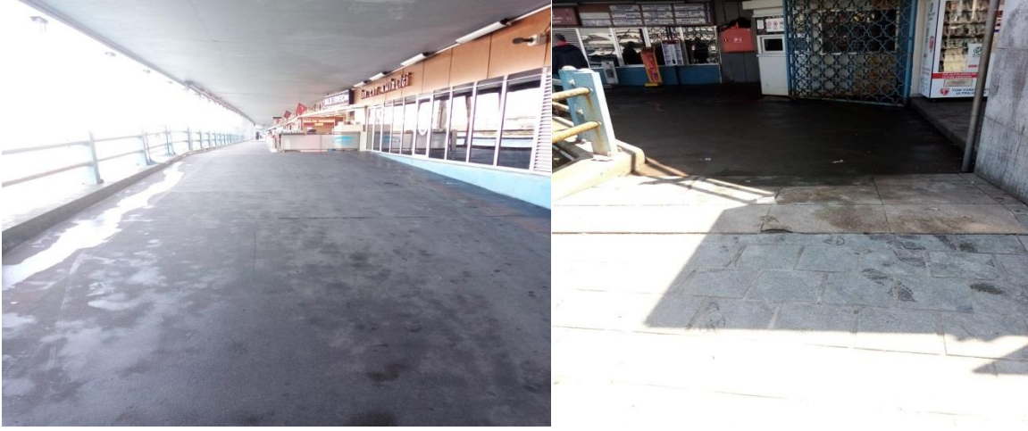
Foto 10. Eminönü Meydanı Turistik çekim alanlarından

Eminönü Meydanı, pek çok ünlü yiyecek-içecek işletmesinin bulunduğu alanlara sahiptir. Foto 9. bu alanlardan birini göstermektedir. İlgili alan tekerlekli sandalye girişi genişliği bakımından oldukça rahat olup evrensel tasarım modeli 'düşük fiziksel çaba' ilkesine uygun bir durum teşkil etmektedir. Bu bulgu etiketlenmeden ve damgalanmadan tüm alanlara erişebilmeyi mümkün kılan engelsiz ve erişilebilir turizm konseptine uygun bir niteliği de işaret etmektedir.