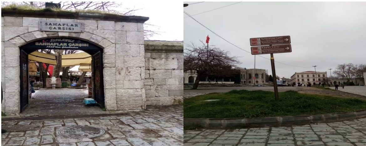
Foto 6. Sahaflar çarşısı