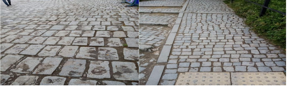
Foto 7. Beyazıt Meydanı zemini

Beyazıt Meydanı'nda yer alan hem yerli hem de yabancı turistler tarafından sürekli ziyaret edilen yerlerden olan 'Sahaflar Çarşısı' fotoğrafta da görüldüğü üzere girintili- çıkıntılı düz olmayan bir zemin döşemesine sahiptir. Bu durum ilgili turistik çekim alanında engelli turistlerin hareket etmesini zorlaştırmakta ve dolayısıyla engelsiz, erişilebilir turizm ve evrensel tasarım ilkeleri ile çelişmektedir. Meydan da yer alan bilgilendirme levhasının yanına görme engelli turistler için Braille alfabeli bilgilendirme levhasının yapılmadığı görülmüştür. 'Algılanabilir Bilgi' tasarımı kapsamında değerlendirildiğinde görsel bilgilerin okunabilirliğini üst seviyede tutmak evrensel tasarımın önemli bir ilkesi olup erişilebilir turizm açısından da elzemdir. Bu unsurun ilgili turistik çekicilik alanında ihmal edildiği görülmektedir.