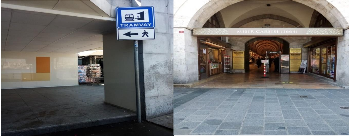
Foto 9. Tarihi Mısır Çarşısı

Türkiye İş Bankası Müzesi: Türkiye İş Bankası Müzesi'nin Tarihi 1800'lü yılların sonlarına dayanmaktadır. Yeni Camii ve büyük Postane binası gibi iki önemli yapının yanında yer almaktadır. 14 Kasım 2007 tarihinde müze olarak faaliyete geçmiş ve turizme açılmıştır. Müze'de, Türkiye İş Bankası'nın kurulduğu günden bugüne kadar Türkiye'nin ekonomik gelişimine tanıklık eden bankacılık ve kurumsal yapı ile ilgili belgeler sergilenmektedir (www.istanbeautiful.com). Evrensel tasarım modeli çerçevesinde Eminönü Meydanında yapılan gözlemler çerçevesinde elde edilen bulgular aşağıdaki gibidir.