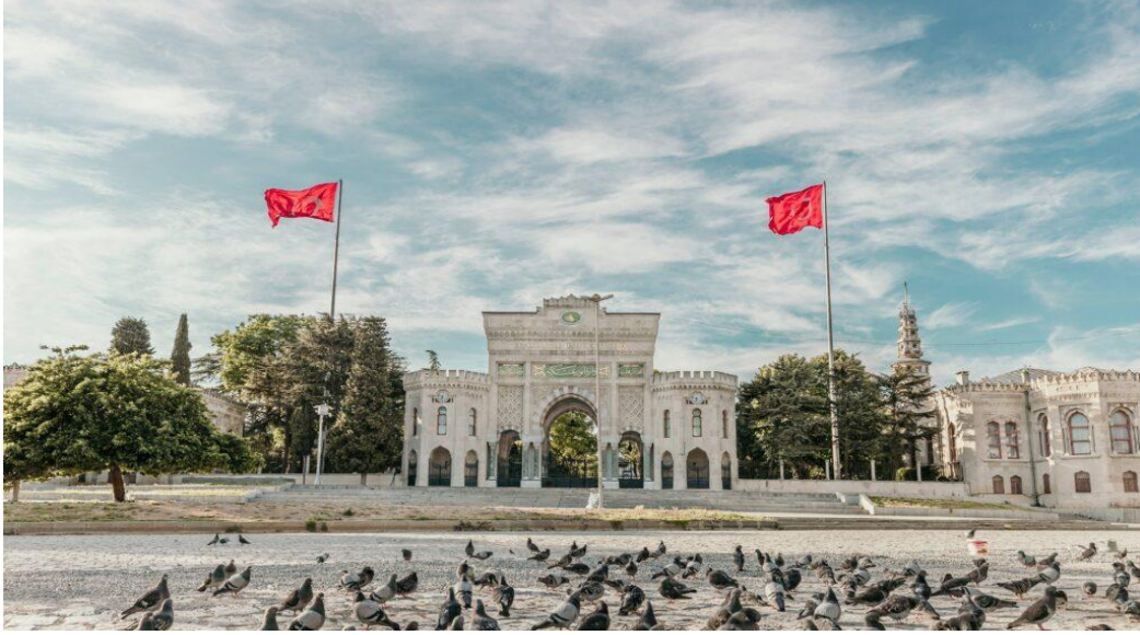
Foto 5. Beyazıt meydanı