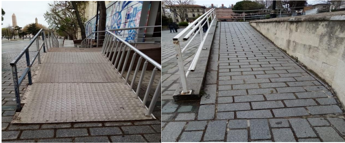
Foto 2. Meydanda yer alan tuvaletler

Evrensel tasarım modeli çerçevesinde Sultanahmet Meydanında yapılan gözlemler çerçevesinde elde edilen bulgular aşağıdaki gibidir.